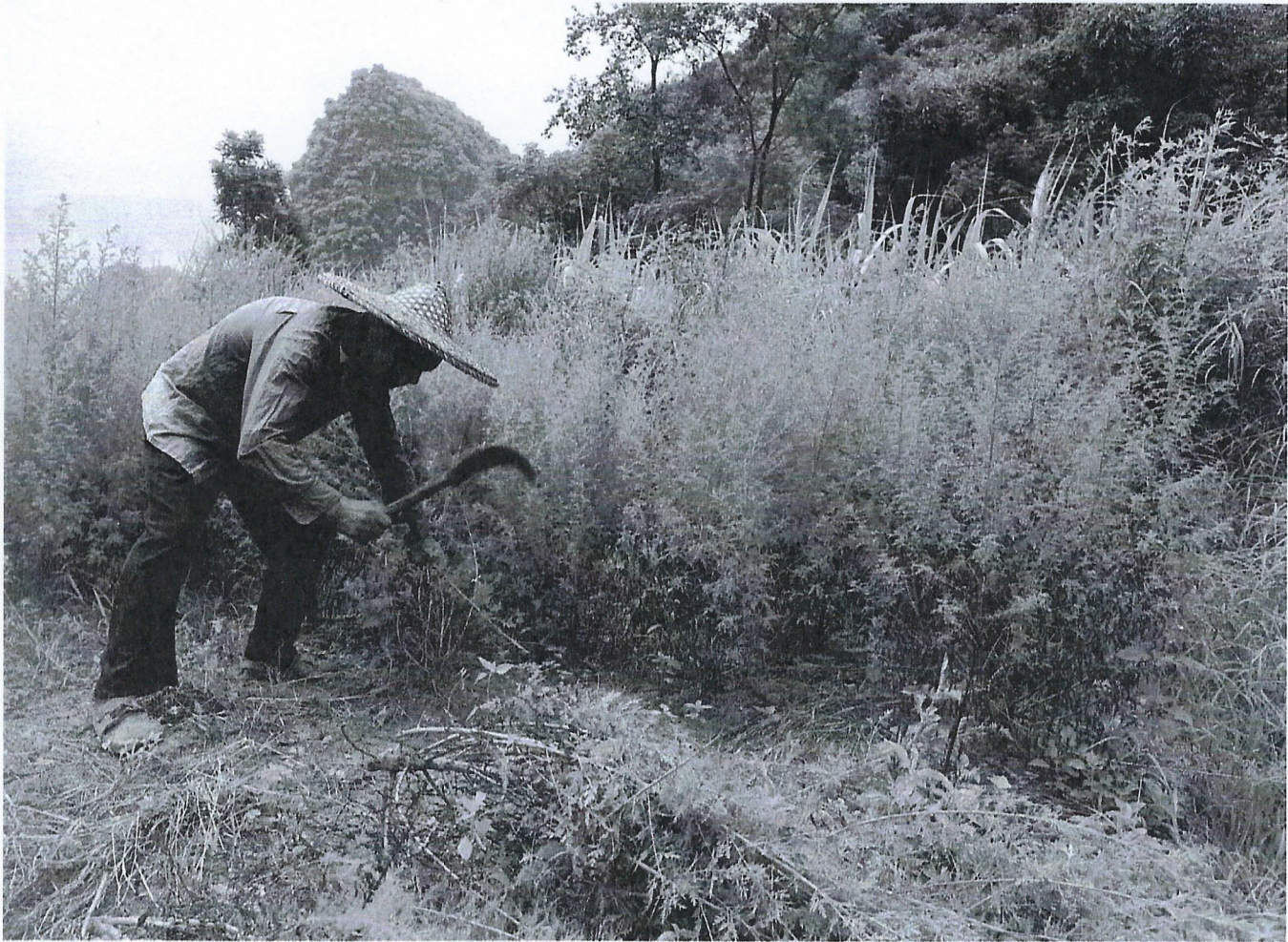
Ein chinesischer Bauer in Linzhou bei der Artemisia-Ernte

wie bei Malaria. Das Geheimnis seiner Wirkung liegt dabei in seiner Reaktion mit Eisen, das sich in hohen Konzentrationen in Malaria-erregern findet. Gerät Artemisinin mit dem Eisen in Kontakt, kommt es zu einer chemischen Reaktion, durch welche freie Radikale erzeugt werden: Die eigentliche Waffe gegen die Malaria-Parasiten. Diese greifen die Zellmembranen an, reißen sie förmlich auseinander und vernichten so die Erreger. Da auch Krebszellen große Mengen an Eisen verbrauchen, um bei der Zellteilung ihre DNS reproduzieren zu können, enthalten auch sie wesentlich höhere Eisen-Konzentrationen als normale Zellen. Weil sich an ihrer Oberfläche viele Transferrin-Rezeptoren befinden, können sie besonders viel Eisen aufnehmen. Diese binden die Eisenteilchen und schleusen sie in das Zellinnere. So pumpen sich die Krebszellen regelrecht mit Eisen voll. Verabreicht man nun Artemisinin, wird die gleiche